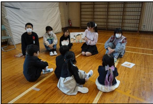
【本の読み聞かせ（入学式）】