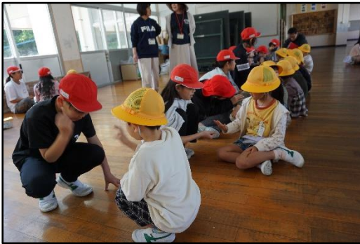
【1年生と6年生出合いの式】